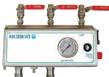
Versions ML et MP